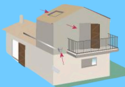
Aménager un étage refuge